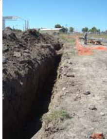
Zanjeo para reemplazo oleoducto interconexión