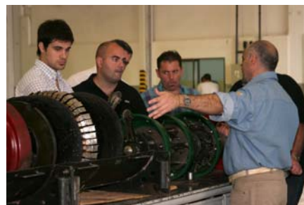
Presentación herramienta inteligente a la comunidad